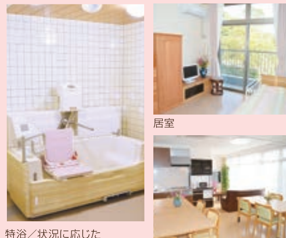
特浴／状況に応じた 特殊浴槽を3種類完備

補助制度により、安価な料金で食事や入浴など、日常生活全般にわたる介護サービスをご提供いたします。