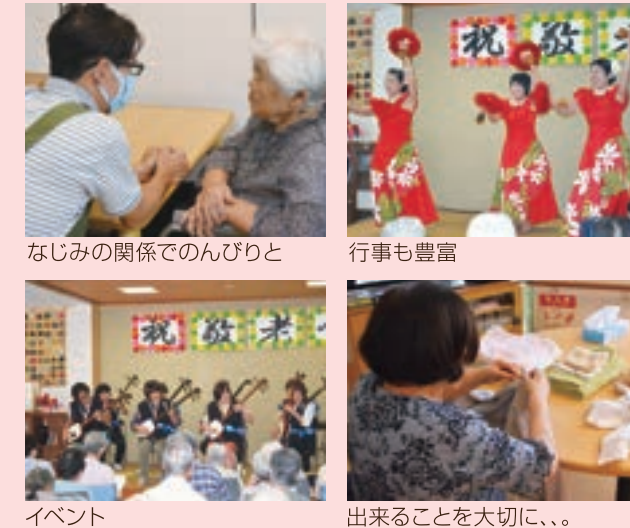
なじみの関係でのんびりと