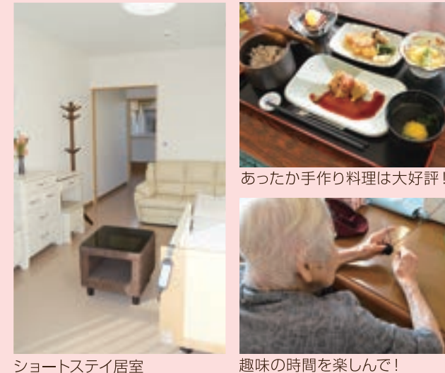
ショートステイ居室