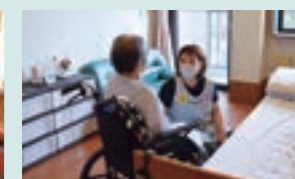
居室 / 完全個室