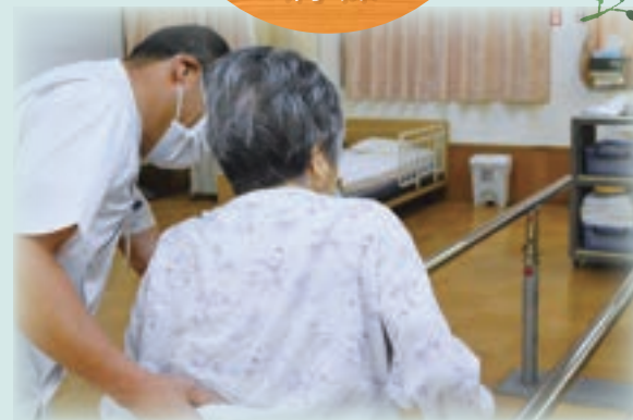
機能訓練室で個別のリハビリ