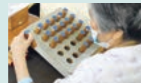
リハビリ / 手先のリハビリ